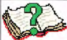
Table of Contents/ Table des matières

P.O. Box 1094, Station/Succ. “B” Ottawa, ON K1P 5R1